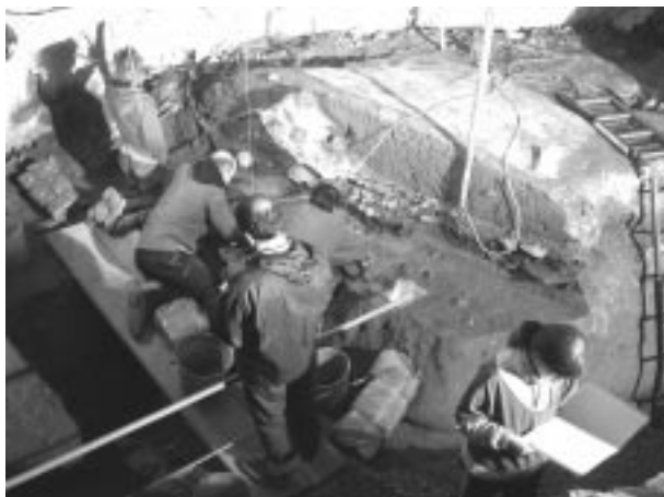
Foto 1: Trabajos de excavación en la cueva de Santimamiñe (Kortezubi). Año 2005.

La conservación del Patrimonio Arqueológico de Urdaibai es un aspecto en el que estamos trabajando de forma tenaz, con resultados que comienzan a ser ya perceptibles. En este sentido, la elaboración del Inventario de Patrimonio Cultural de Urdaibai (I), que incluye todos los registros constatados desde la Prehistoria a época romana, está siendo esencial para la protección de los yacimientos arqueológicos (de ello se informa en el segundo artículo de este volumen). La represen-