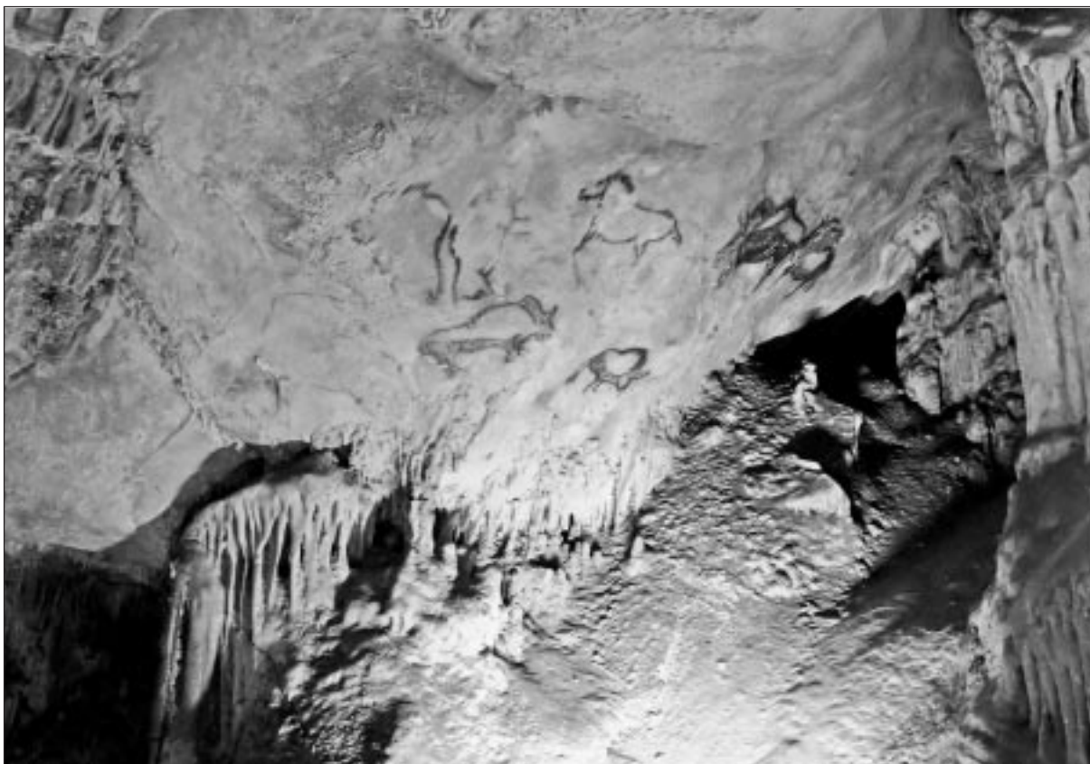
Foto portada: Conjunto rupestre magdaleniense de la cámara de Santimamiñe. Bizkaiko Foru Aldundia - Diputación Foral de Bizkaia.