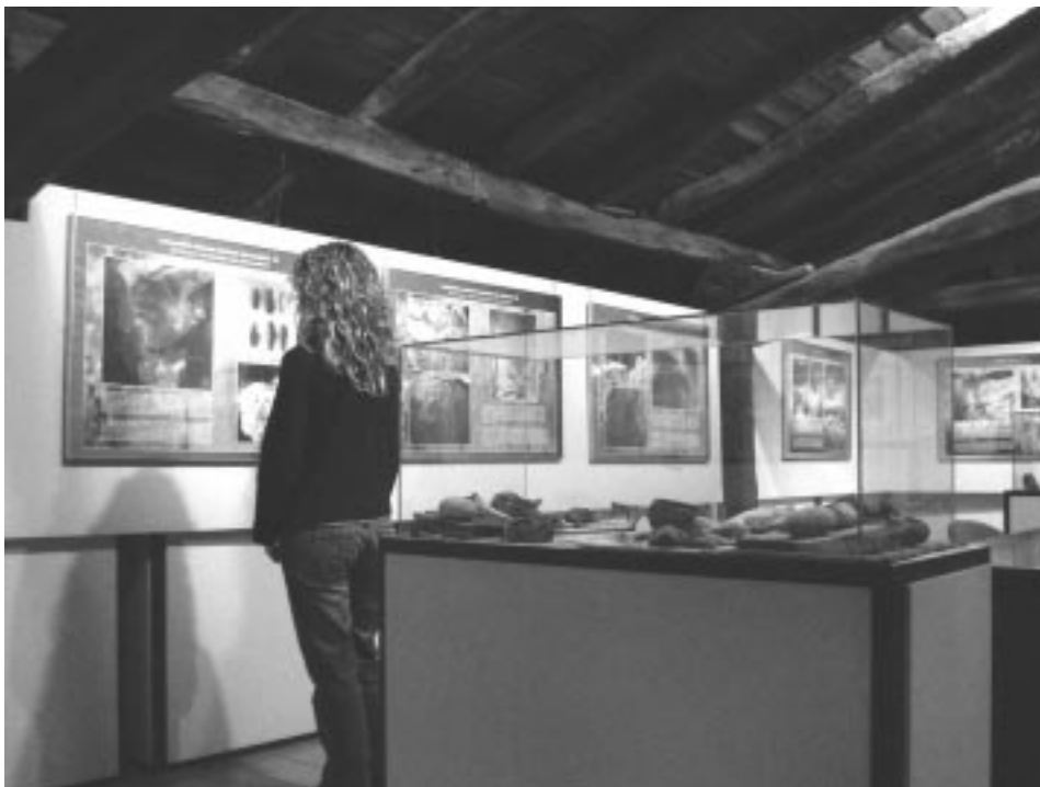
Foto 2: Exposición "El arte Paleolítico" en el Arrantzale Museoa (Bermeo).

Herriko eta Iberiar Penintsulako arkeologia ikerketaren esparruan berriak diren gaiei buruzko hitzaldi ziklo bat.